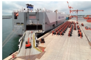
茨城港常陸那珂港区