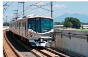
つくばエクスプレス